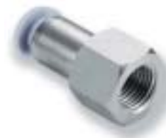
Прямой переходник (с внутренней резьбой)