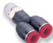
Поворотный Y-образный переходник