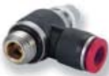
Регулятор расхода типа "банджо" (выходной)