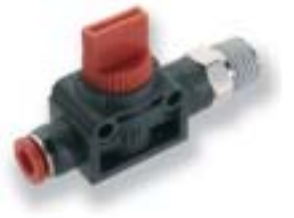
Ручной клапан труба-резьба