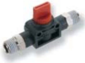
Ручной клапан с резьбы на резьбу

Труба с наружным диаметром Ø 3 ... 16 мм