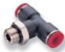
Поворотный Т-образный переходник (охватывающий)