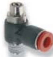
Фитинг типа "банджо" с кожухом