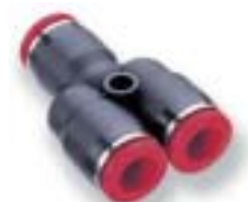
Проходной Y-образный фитинг (для труб одинакового диаметра)