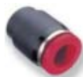
Крышка (заглушка с внутренней резьбой)