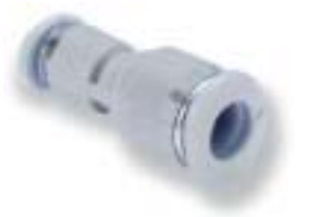
Прямая муфта (для труб различного диаметра)