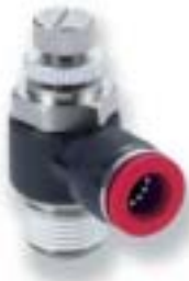
Регулятор расхода типа "банджо" (выходной)

Труба с наружным диаметром Ø 3 ... 16 мм