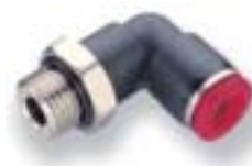
Коленчатый переходник с углом поворота 90°