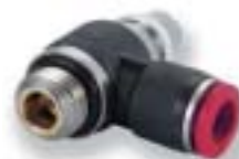
Регулятор расхода типа "банджо" (входной)