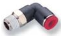
Коленчатый переходник с углом поворота 90°