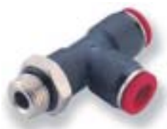
Поворотный прямой Т-образный переходник

Труба с наружным диаметром Ø 3 ... 16 мм