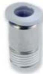
Прямой переходник (только с внутренним шестигранником)