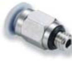
Прямой переходник (с внешним шестигранником)