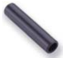
Стержневая муфта (для труб различного диаметра)

Труба с наружным диаметром Ø 3 ... 16 мм