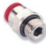
Прямой переходник (с внешним и внутренним шестигранником)