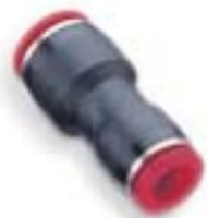
Прямая муфта (для труб различного диаметра)