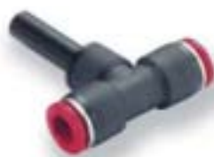
Стержневой тройник (для труб одинакового диаметра)