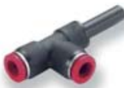
Стержневой прямой тройник (для труб одинакового диаметра)