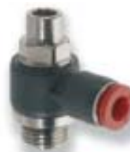
Фитинг типа "банджо" с кожухом