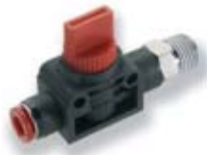
Ручной клапан резьба-труба